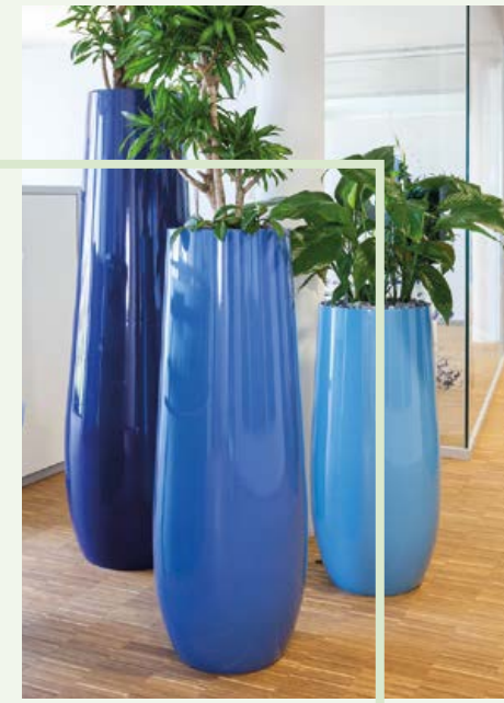
KUNSTSTOFF IN FORMEN UND FARBEN