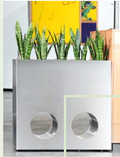
EDELSTAHL- GEFÄSSE SUPERLINE®