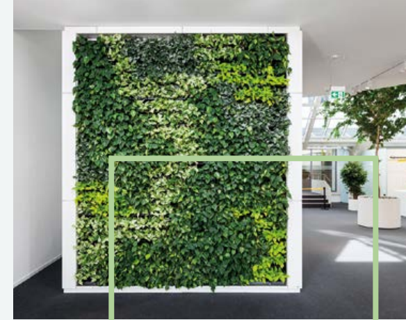
DIE LIVING WALL