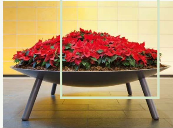
BOTANIC OFFICE SCHALE